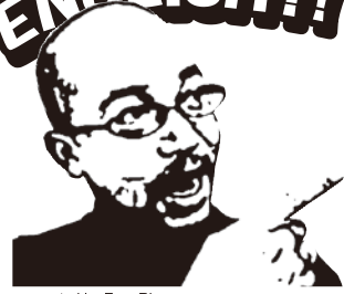
presented by Eros Rivers